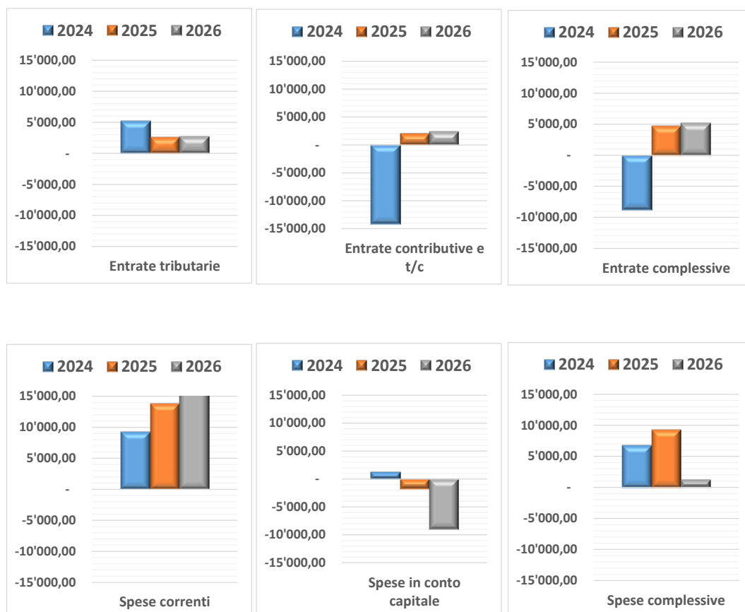
Figura 2 – Effetti netti della manovra sulle entrate e sulle spese (Impatto in termini di indebitamento netto)

Segno “-“ = effetto peggiorativo sull’indebitamento netto